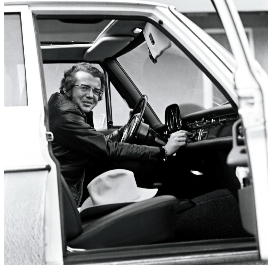
Abb.: Stadtarchiv Saarbrücken, Nachlass Fotograf Fritz Mittelstaedt (2,3), Abb. Peugeot (4) und Gerhard Heisler (6).